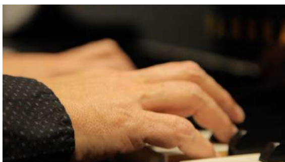
Extrait musical: COMME DEUX GOUTTES D'EAU