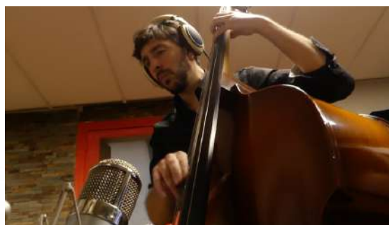
Extrait musical: ENRICO L'A DIT

“L'aurore, c'est le moment magique où tout est possible, où tout est promesse, où la vie va apparaître, réapparaître, comme dans un tressaillement léger qui libère et révèle son énergie, sa force.